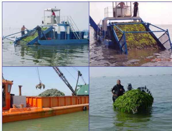
Trattamento delle alghe raccolte in Sacca di Goro