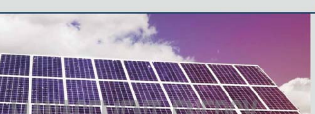
3 ENERGY MANAGEMENT