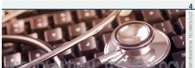
4 INFORMATION TECHNOLOGY