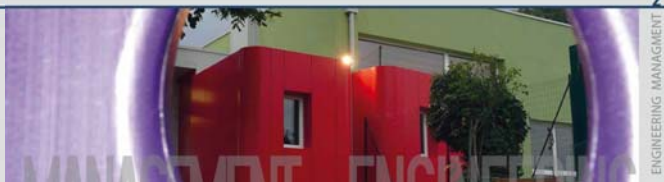
2 ENGINEERING MANAGEMENT